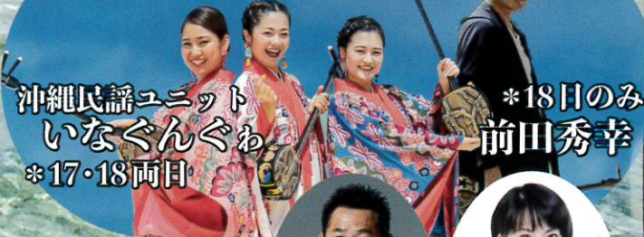
沖縄民謡ユニット いなぐんぐわ *17・18両日