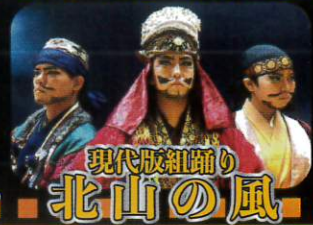
現代版組踊り 北山の風