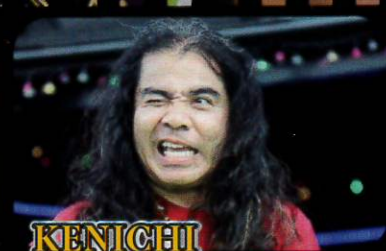
KENICHI & King Voices