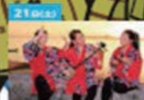
21 09:30 いなぐんぐん LIVE