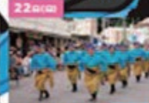
22 09:00 旗ジユネー(パレード)

美らなる島の輝きを御万人へ 一般財団法人 沖縄美ら島財団 Okinawa Chirashita Foundation http://okishirashita.or.jp/