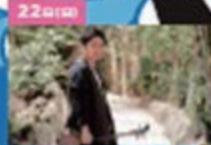
22 09:00 町民舞踊 LIVE